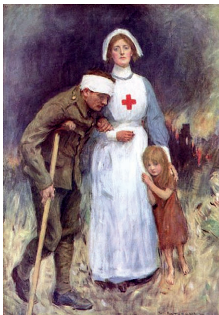
Dobrovolná sestra Červeného kříže na vyobrazení z 1. světové války – ztělesnění principu dobrovolnosti

Co je důvodem tohoto požadavku? Je skutečností, že ten, kdo je motivován snahou pomoci druhému, bude svou službu poskytovat opravdově, s plným využitím své kvalifikace, že se skutečně bude řídit snahou maximálně lidské utrpení zmírňovat či mu předcházet, zkrátka že pro něj bude prioritou pomoc druhému člověku. Toto nelze podchytit jakýmkoli směrnici, standardizovanými postupy pro konkrétní případy či dohledem. Obětavě bude jednat jen ten, u něhož je práce prostřednictvím Červeného kříže pomocí potřebným.