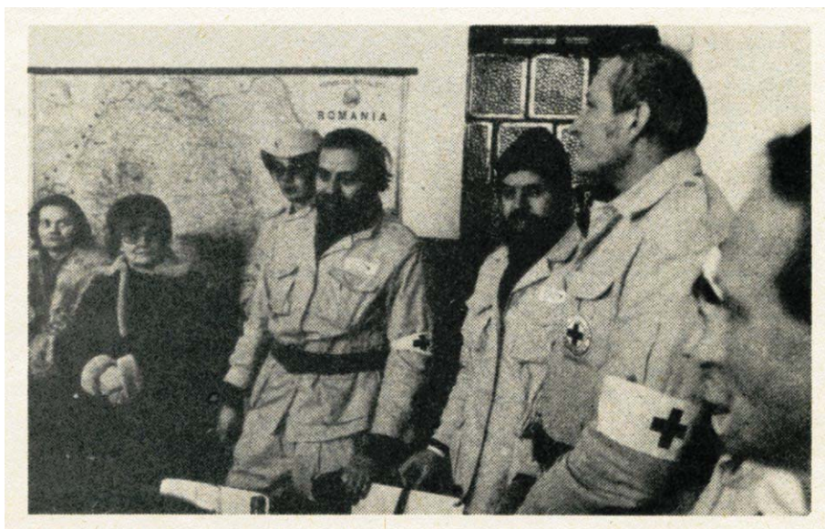
První humanitární pomoc po Listopadu směřovala v zimě 1989/90 do Rumunska – přijeti naší skupiny ve škole v Sinteu

5. března 1992 přijalo Federální shromáždění České a Slovenské Federativní Republiky současný zákon o Československém červeném kříži - zákon č. 126/1992 Sb., o ochraně znaku a názvu Červeného kříže a o Československém červeném kříži. Ve své první části zakotvuje závazky Československa na úseku ochrany znaku Červeného kříže, jak vyplývají z Ženevských úmluv na ochranu obětí válek. Zakazuje