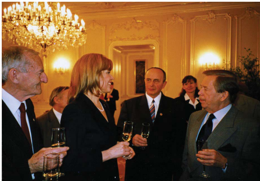
Přijetí dárců krve prezidentem V. Havlem – duben 1996 (vlevo Z. Vlk)

Zmíňme se nyní velmi krátce o činnostech ČSČK a ČČK, jak jsou rozvíjeny od r. 1990 podnes. Kromě činností, které Červený kříž uskutečňoval již v předchozím období, se začaly objevovat i činnosti nové, resp. navazující na tradice ČSČK z doby před změnou jeho postavení začátkem 50. let.