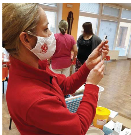
Domov seniorů - zdravotnice ČČK se chystá očkovat

Na prahu roku 2021 je situace nejen v naší zemi vážná. Pozitivní je existence vakcíny proti Covid-19 a rozvíjející se očkovaní . To je další významná zbraň z arzenálu proticovidových opatření – čím více lidí bude očkováno, tím bude mít virus menší šanci se v populaci šířit – chráníme nejen