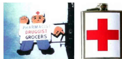
příklady neoprávněného použití znaku Červeného kříže

Zdůraznit je třeba, že oba výše uvedené výchyty oprávněných uživatelů znaku jsou taxativní – jinými osobami, právníckými ani fyzickými, nebo pro jiné účely nesmí být znaku ČK za žádných okolností použito.