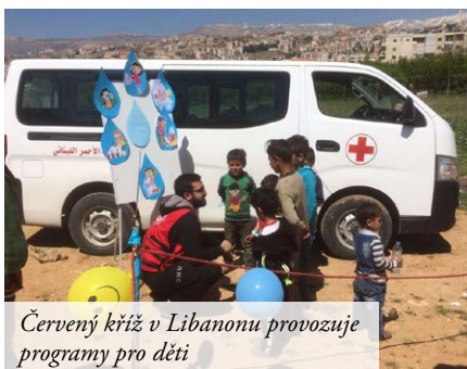
Červený kříž v Libanonu provozuje programy pro děti

14.4.2017 v ranních hodinách byla do Li- banonu dopravena zásilka s humanitární po- mocí určenou dětem – syrským běžencům. Zásilka obsahuje školní potřeby, hračky, šatstvo a sportovní obuv. Celková hmotnost zásilky činí 503 kg a její hodnota 99.781 Kč. Šatstvo a hračky pocházejí ze sbírky uskuteč- něné studenty International School of Prague , sportovní obuv poskytl Nadační fond Shoes- 4Life a školní potřeby zakoupil Český červený kříž , který se rovněž ujal organizace pomoci.