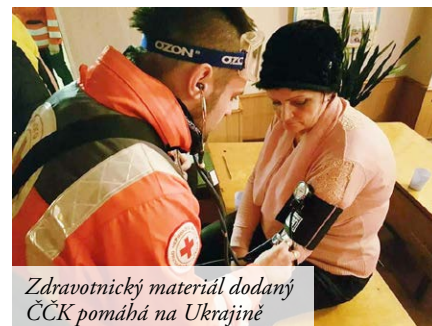
Zdravotnický materiál dodaný ČČK pomáhá na Ukrajině

žené nedávnými boji, jde zejm. o přikrývky, stanové přístřešky, svíčky, vaříče apod.