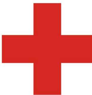
možné provedení znaku Červeného kříže

červené barvy ani tvar hranic či odstín jeho bílého podkladu – nejčastěji se používá kříž rovnoramenný, tzv. kříž z pěti čtverců nebo se takto opticky jeví.