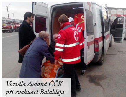
Vozidla dodaná ČČK při evakuaci Balakleja

Dne 23.3.2017 došlo k požáru a následně- mu výbuchu skladu munice ve městě Ba- lakleja v Charkovské oblasti. Při evakuaci obyvatelstva a ošetřování raněných zasahoval charkovský Oddíl rychlé reakce Ukrajin- ského červeného kříže. Při akci byly použity zdravotnický materiál (speciální traumasety) i vozidla dodané Českým červeným křížem.