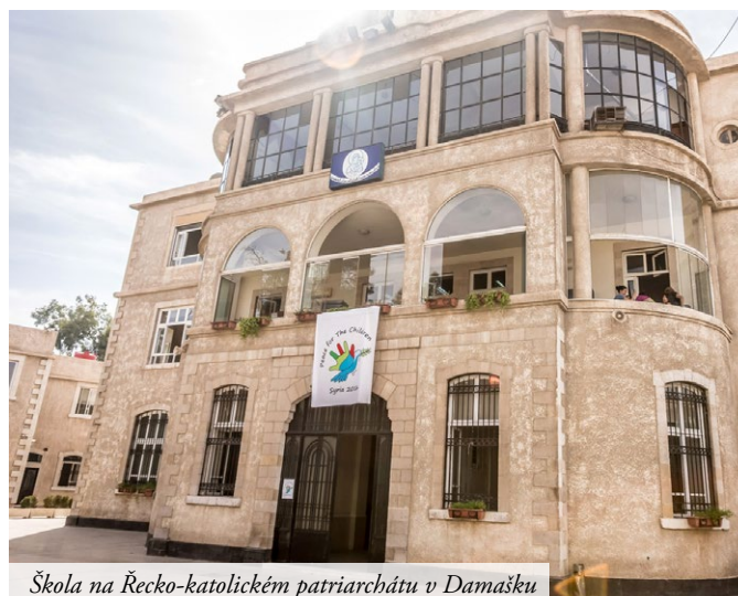
Škola na Řecko-katolickém patriarchátu v Damašku