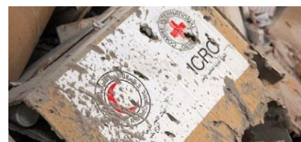
Materiál zničený útokem na konvoj v Sýrii