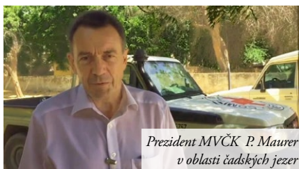
Prezident MVČK P. Maurer v oblasti čadských jezer

Wanzam v Nigeru během 3 červnových dní zvýšili uprchlíci počet obyvatel z 1.500 na 30.000!