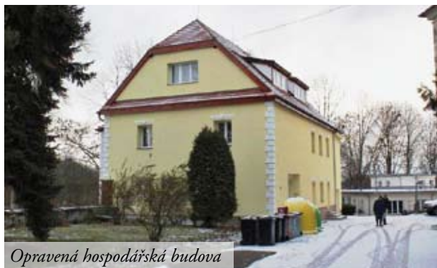
Opravená hospodářská budova