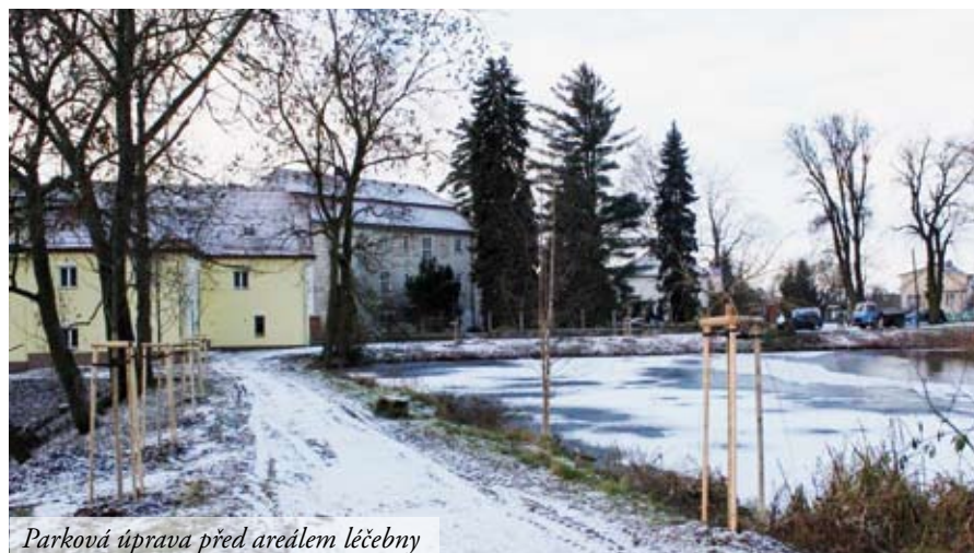
Parková úprava před areálem léčebny

Ale pojďme domů, co je nového v Bukovanech? V roce 2013 pokračova-