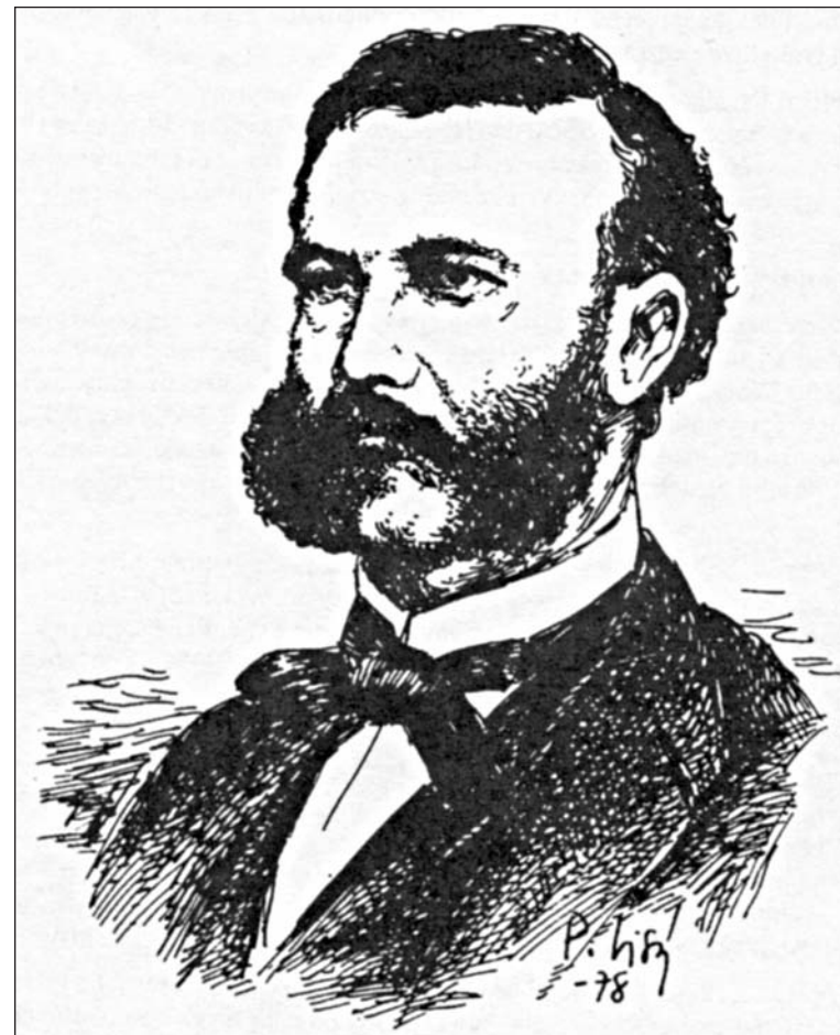
HENRI DUNANT zakladatel Červeného kříže