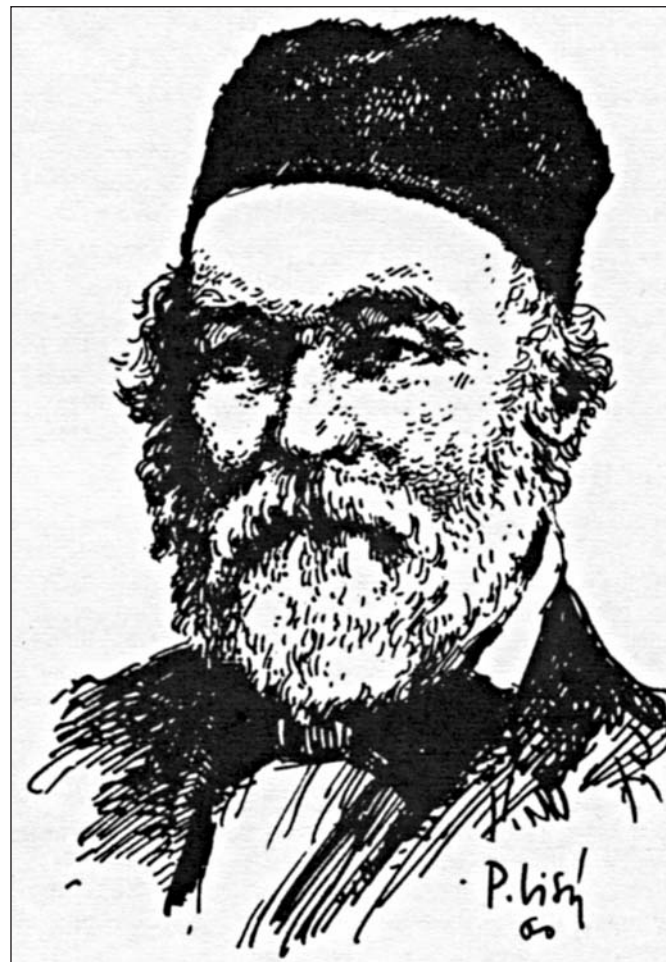
N. I. PIROGOV ruský chirurg

Zdůrazňoval, že zranění je třeba léčit podle druhu zbraně, která jej zavinila. Upozorňoval, že nestačí raněného pouze ošetřit, ale že je třeba jej také z bojiště odsu-