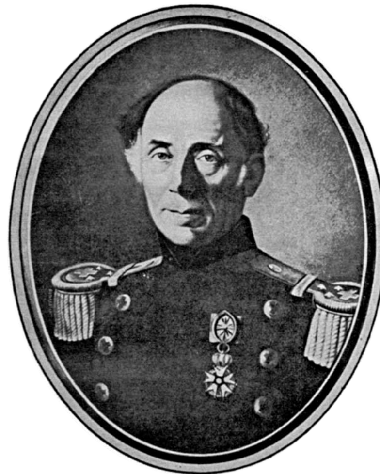
HENRI GUILLAUME DUFOUR

Generál Dufour nebyl pacifistou v obvyčejném slova smyslu. Jako profesionální voják věděl, že nebude možné brzy odstranit války, ale viděl v nich jen prostředek k hájení práva. V roce 1847 byl jmenován velitelem armády pro válku se Sonderbundem (dokázal ji vítězně ukončit po pouhých 25 dnech takřka bez prolítí krve). A právě v této válce již vydal řadu humánních nařízení, která se později stala součástí mezinárodního humanitárního práva. Posuďte sami nadčasovost jeho tehdejších nařízení: