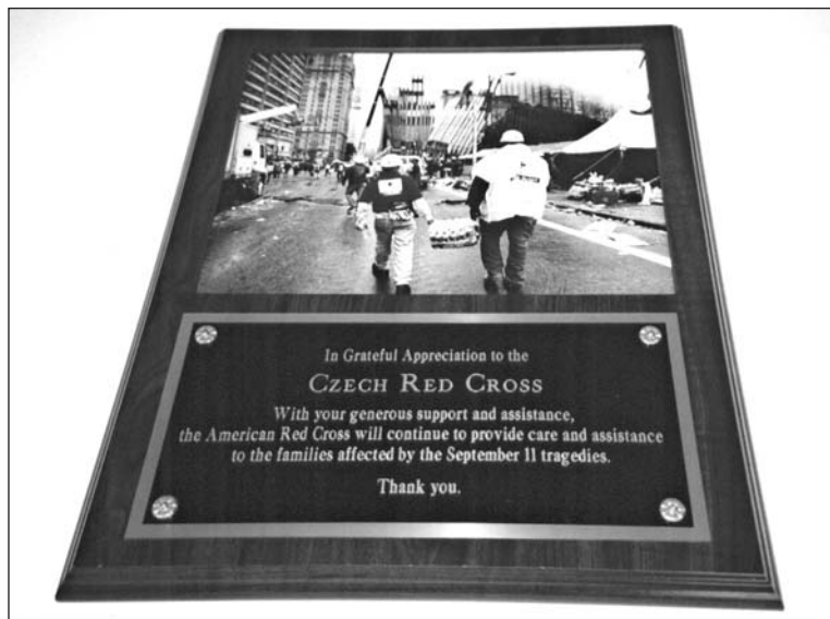
Čestná plaketa Amerického ČK udělená ČČK

FOND HUMANITY ČČK Číslo konta 10030-7334011/0100 Komerční banka Praha 1